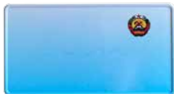
Chapa Traseira 305 x 165 mm