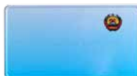
Chapa Traseira 240 x 130 mm