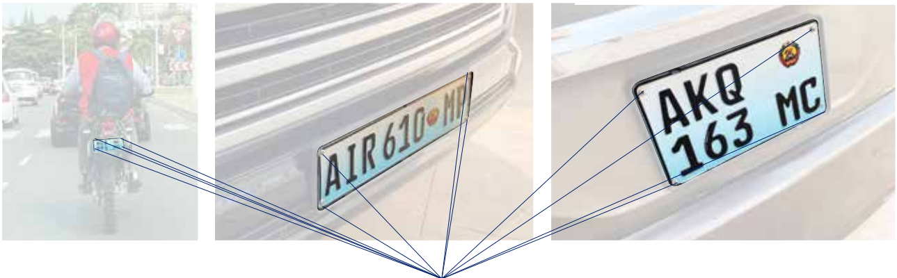
Rebitagem da chapa de matrícula na viatura