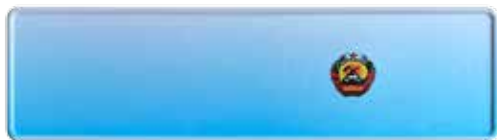
Chapa Dianteira 440 x 120 mm